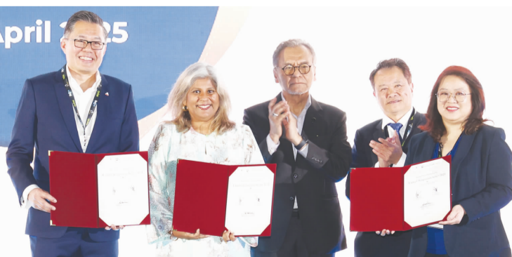
Prince Court Medical Centre 与大马国家癌症协会签署备忘录。祖基菲里 (右三) 及张焜焰 (右二) 共同见证。

(吉隆坡 24 日讯) 第 25 届东南亚医疗及制药展暨论坛大会 (SEACare 2025) 于昨日在马来西亚国际贸易会展中心 (MITEC KL) 盛大启幕。卫生部长拿督斯里祖基菲里莅临开幕，见证多项合作签约仪式，并颁发杰出医疗服务奖给卓越贡献的权威专家，以表彰他们的辛勤付出和专业精神。