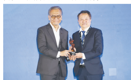
张焜焰 (右) 颁发感谢状于祖基菲里出席开幕礼。

卫生部长祖基菲里 跨境合作促医疗韧性 祖基菲里表示，数字化正在重塑医疗保健、远程医疗、人工智能等技术带来变革，但核心目标应该是提升患者护理、消除医疗壁垒，以及构建稳健的医疗体系。